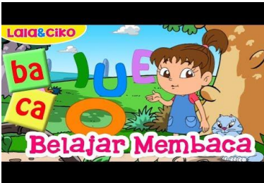
Aspek perkembangan: Bahasa