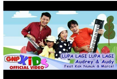
Aspek perkembangan: Bahasa

Bimbingan Orang Tua Setelah Menonton: Setelah tayangan ajak anak untuk menceritakan kembali isi cerita yang telah ditonton dan bermain tebak huruf.