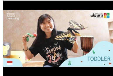
Aspek perkembangan: Bahasa