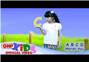
Aspek perkembangan: Bahasa